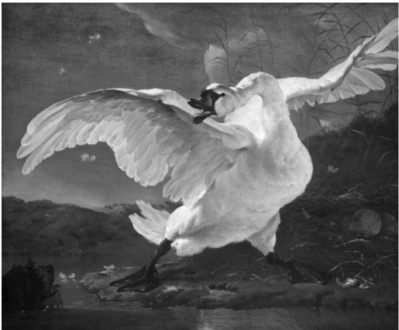
Jan Asselijn, De bedreigde zwaan (1650)